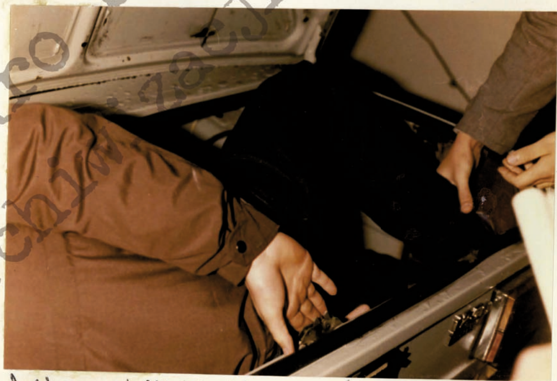
② Podejrzany W. Chmielenski poprosił udzielenie mu ciała porożnika